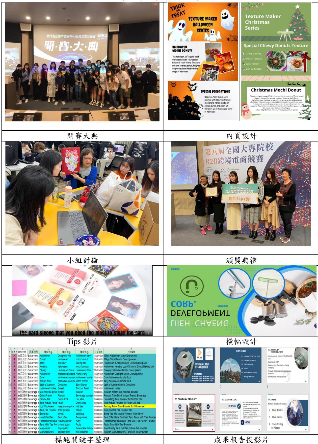
表 7-學生學習歷程紀錄匯整