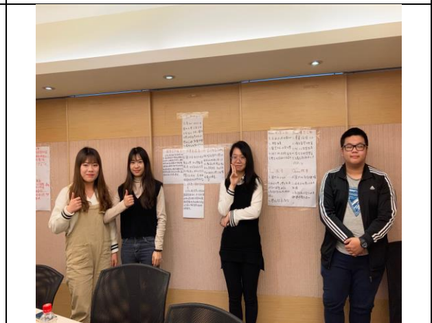
學生問題導向學習議題討論