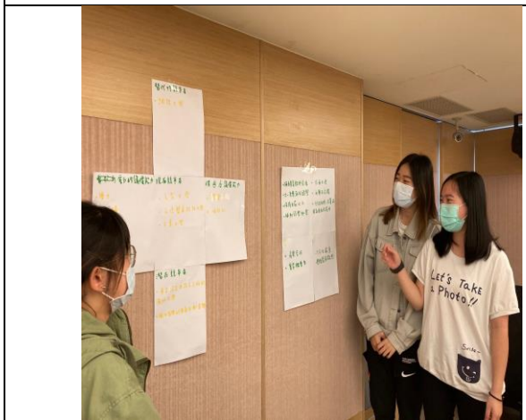
學生問題導向學習議題討論