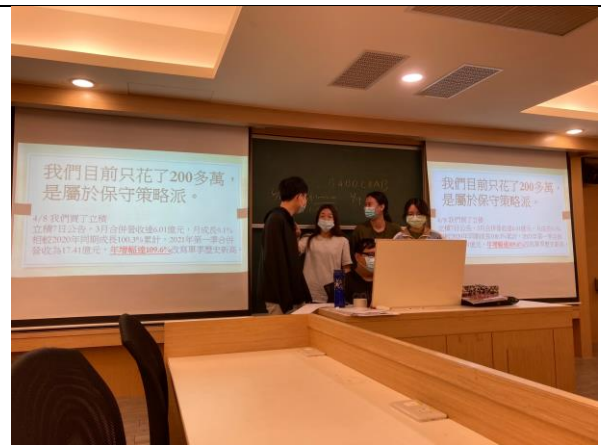
學生虛擬投資競賽期中報告