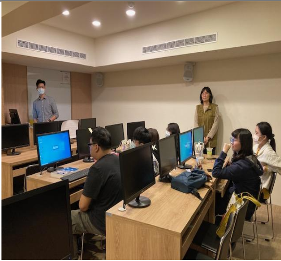
虛擬投資競賽操作說明