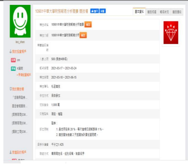
虛擬投資競賽規則