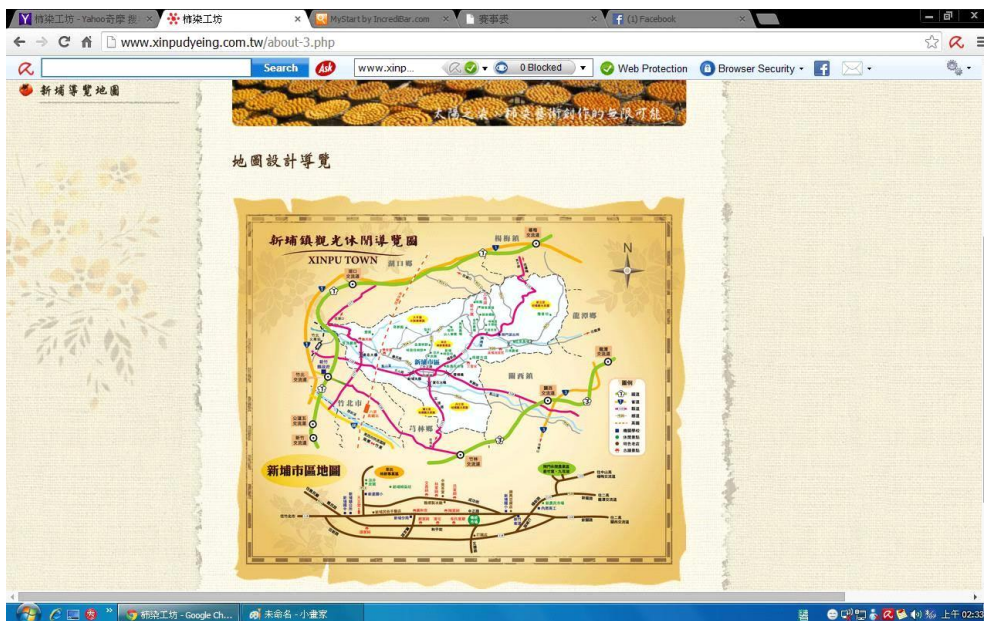
圖 2-3.3 新埔導覽地圖