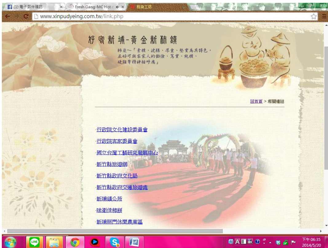
圖 2-3.11 柿染工坊相關連結