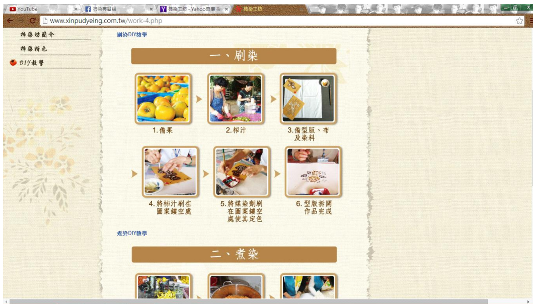
圖 2-3.6 柿染 DIY 簡單的介紹 圖來源同為圖 2-3.1

如果第一個標題內容有吸引到遊客，到了第二標題內容，柿染的介紹是都很清楚，唯一不足的事，交通路線卻是在介面中下個連結之後圖 2-3.7，以小圖一部份的方式呈現圖 2-3.8，應該放在明顯易見的地方，又或是在上面特別加上交通路線的連結，可以提供從外縣市的路線，又或是當地的食衣住行，如果可以先幫遊客規劃好一些行程，也許可以讓不喜歡自己規劃的人直接套用。