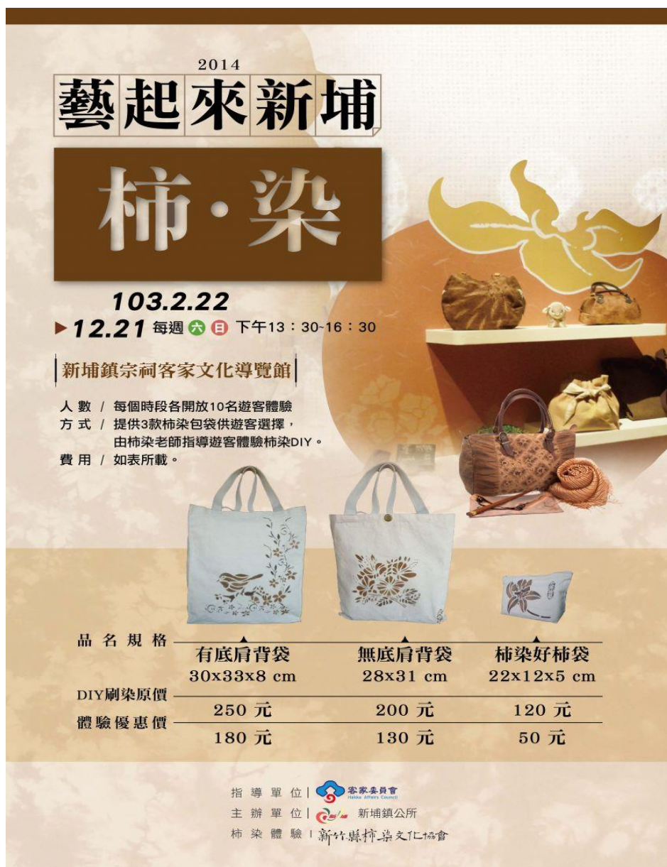
圖 2-2.3 藝起來新埔的官方活動導覽圖