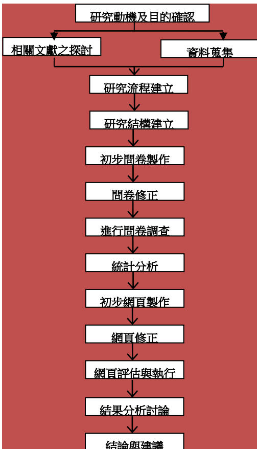
圖 1-4.1 研究流程圖，此圖主要是論述我們的流程步驟

本文將使用問卷與網頁設計的方式來推廣行銷柿染活動，流程首先決定研究動機與目的，而後進行資料收集、參考文獻，再進一步實地訪問製作問卷調查、網頁設計最後完成實施結果分析結論與建議，研究流程圖如圖 1-4.1：