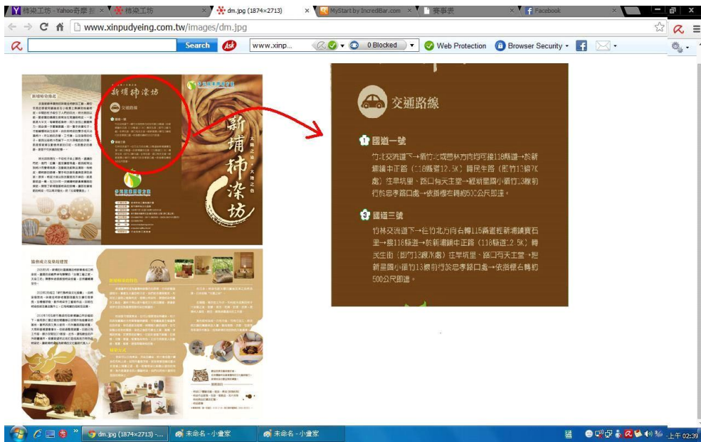
圖 2-3.8 交通路線連結 圖來源同為圖 2-3.1