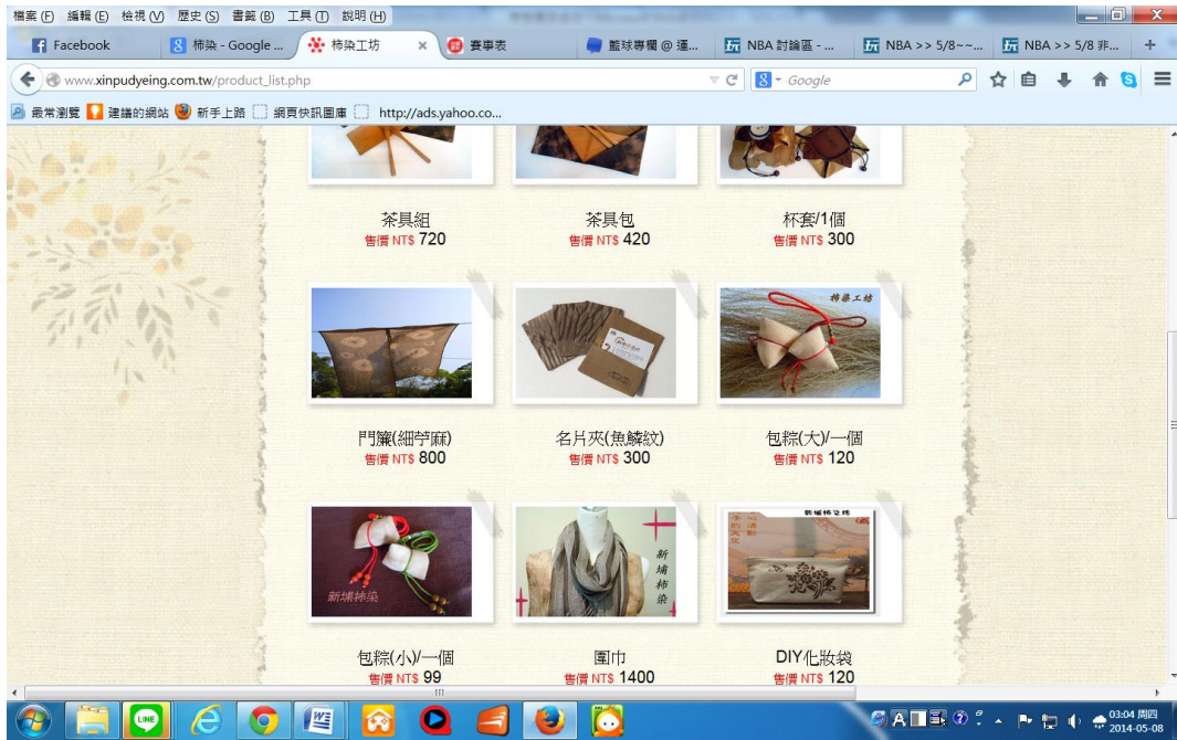
圖 2-3.9 柿染產品 圖來源同為圖 2-3.1