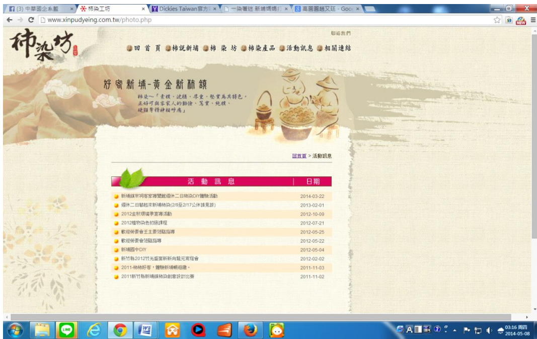
圖 2-3.10 柿染工坊的活動訊息 圖來源同為圖 2-3.1