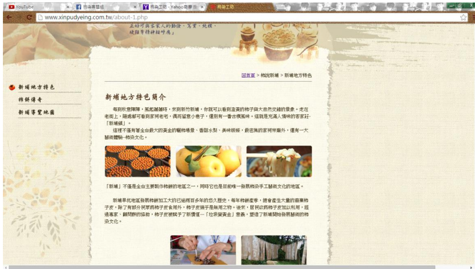
圖 2-3.2 新埔、柿餅的介紹

在第一個標題《柿說新埔》中，就先介紹了柿餅和新埔的地方介紹圖 2-3.2，擺著新埔導覽地圖圖 2-3.3