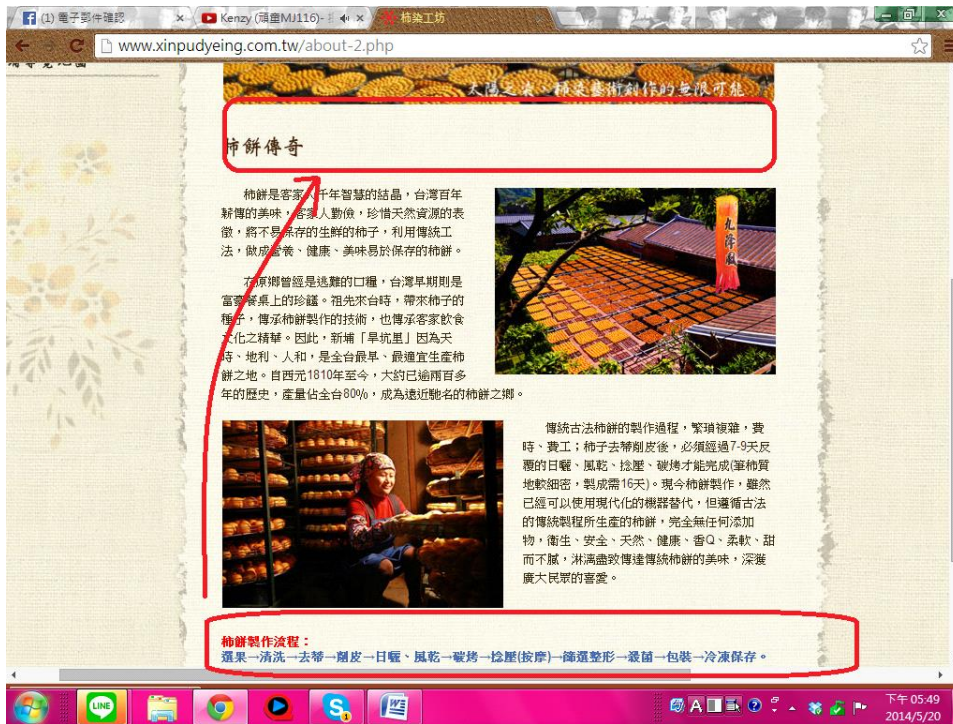
圖 2-3.4 柿餅的製程與歷史