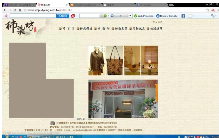
圖 2-3.1 柿染工坊首頁

圖 2-3.1 為新埔柿染工坊的官方網頁的首頁，從裡面的內容我們可以看到，標頭有著柿染的產品手工藝介紹，引導我們的活動訊息及柿染坊的許多照片。