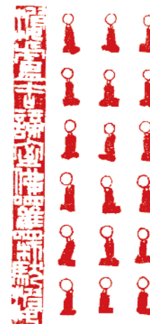
婆盧羯帝 室佛囉楞伽婆