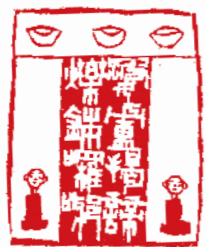
婆盧羯帝 爍鉢囉耶