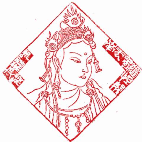
南無 喝囉怕那 哆囉夜耶