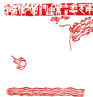
南無悉吉 憐埵 伊蒙阿唎耶