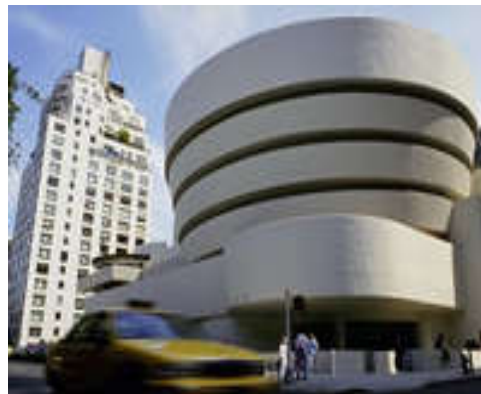
(D) 紐約，古根漢博物館